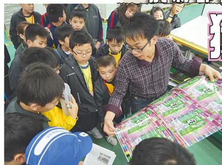
哈哈！我認識這品牌，原來包裝盒是他們印刷的。