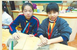
老師講解搓泥技巧