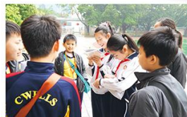
我們與實驗小學同學在互相訪問中