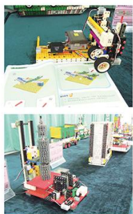
多元化的數碼產品

龍昌集團於1964年成立，由生產單一玩具發展到現在的智慧、教育、電子數碼合的多元化產品。於2004年成立東莞龍昌數碼科技有限公司，2009年與華特迪士尼合作生產玩具。 我們當日參觀其中一條生產線，每個玩具部件分類分置生產線上，由工人負責組合不同的零件；完成組裝後，經過質量檢查再出售。他們的產品有五種年齡層次，分別是OM+、3Y+、12M+、18M+及5YT，根據動畫片而製作出玩具。參觀他們的生產過程，我們大開眼界，了解到科技如何協助玩具廠發展出不同種類的玩具，實在眼界大開！