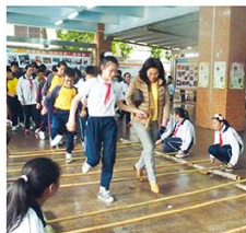
趙校長也被邀請一起跳竹竿舞