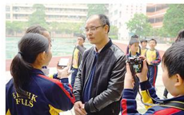
我們訪問邵校長，他很認真地回答問題