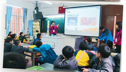
老師講解陶藝的起源