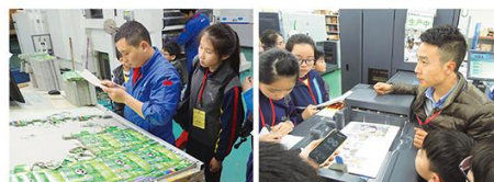
小記者很留心聆聽專業技師講解。

於1988年創立的虎彩印藝股份有限公司，擁有亞洲最大規模數字印刷機群，名列中國印刷百強中第九名；業務涵蓋包裝印刷、激光科技、學生文化用品連鎖及啤酒的綜合性產業集團。我們在參觀廠房中，學到不同打印法，如：數碼打印、UV打印、個性打印等，廠內每一部打印機可在一小時內印出8000張作品。在這次活動中，令我們對3D印刷技術的知識增加，獲益良多，實在是學校為我們的生涯規劃中作出準備。