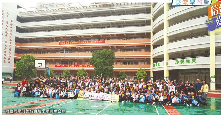
兩校同學於莞城實驗小學操場合照

莞城實驗小學建於1988年，設有49個教學室，有143名教師，學校秉持「求真納新」的理念，是廣東省一級學校。