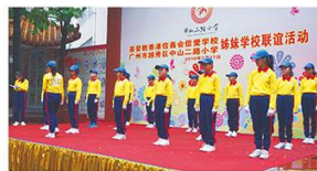
本校交通安全隊表演手號操

這次「校園小記者交流」，我們參觀了姊妹校——廣州市越秀區中山二路小學，來到學校，幾位學生司儀和我們的幾位同學一起以普通話及英語唱歌。接著，他們低年級的學生表演舞蹈，同學們穿著色彩鮮豔的服飾，拿著傳統紙雨傘起舞；然後，就是高年級的學生表演新穎的傳統舞蹈。在充滿民族色彩的音樂的伴奏下，他們輕輕擺動身體，令我們如置身在新疆的感覺。跟著，我們的交通安全隊表演手號操，我們向大家介紹交通警察在十字路口使用的手號。 中山二路小學以陶藝教育著名，老師們對陶藝的認識深厚，空閒時會製作一些陶藝手工，連家中的茶具也是自製作品。我們嘗試製作，但原來不易，老師們的手很靈巧，輕易便弄出一朵美麗又整潔的小花，我們很多同學連一個圓也無法弄出來，還覺得一團糟。雖然未能成功搓出漂亮又精緻的作品，但我們那天非常愉快，印象難忘。