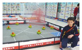
參觀完後，他們送我們玩具啊！