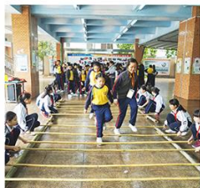
跳竹竿舞，很好玩呀！