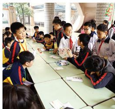
寫明信片，寫什麼內容給自己和家人呢？