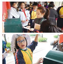
我們已經成功在實驗小學的少年郵局中投寄信件