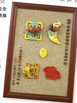
中山二路小學送給我們的紀念品