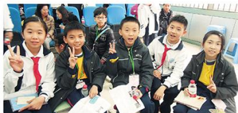
大課間玩得盡興，要坐下休息