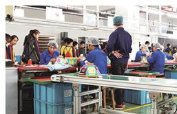
工人在生產線上負責組裝配件