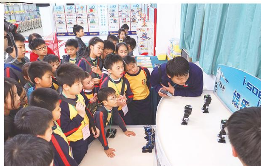
技術員講解新研發的玩具，是如何操作的。

龍昌集團於1964年成立，由生產單一玩具發展到現在的智慧、教育、電子數碼合的多元化產品。於2004年成立東莞龍昌數碼科技有限公司，2009年與華特迪士尼合作生產玩具。 我們當日參觀其中一條生產線，每個玩具部件分類分置生產線上，由工人負責組合不同的零件；完成組裝後，經過質量檢查再出售。他們的產品有五種年齡層次，分別是OM+、3Y+、12M+、18M+及5YT，根據動畫片而製作出玩具。參觀他們的生產過程，我們大開眼界，了解到科技如何協助玩具廠發展出不同種類的玩具，實在眼界大開！