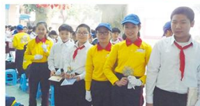
互相配對，結成好友！