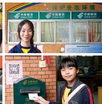
我們寄明信片回香港