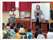
幼稚園學生現場學拼音

為了讓家長和社區人士對本校的課程和教學有更深入的認識，本校於2012年9月15日舉行了「915優質教學體驗日」。體驗日內容非常豐富，包括英文科RWI的示範教學及體驗課，中文科識字教學和數學科的應用題教學示範課，整個教學體驗日在愉快和有趣的氣氛下完成，獲得好評。