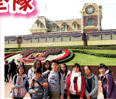
隊員免費到迪士尼樂園遊玩，享受愉快的一天。

交通安全隊在本年度繼續專注紀律訓練，透過步驟練習，提升隊員專注力及服從性；又鼓勵隊員積極參與社會服務，擴闊視野，建立正面的價值觀。