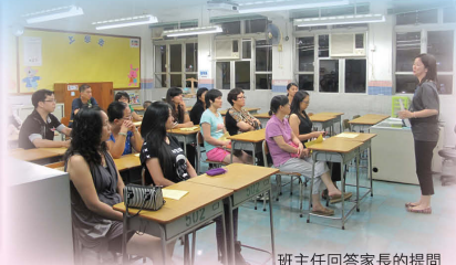
班主任回答家長的提問