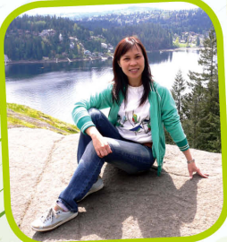
Taking a break at Deep Cove, Vancouver, while hiking

I will do my best to work with my colleagues and hope that I can be of great assistance to the school.