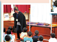
老師化身成魔術師教拼音