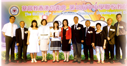
校董會與獲獎同工合照