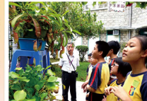
同學對中草藥很感興趣

香港回歸祖國後，培養學生的國民身份認同是一項重要的教育任務，亦是課程改革的目標之一。本校構思了一系列「國民身份認同」活動，9月19日參加國民教育中心日營，讓學生認識源遠流長的中國文化。