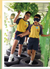
經驗學習最重要、合作學習齊進步