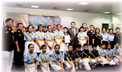
本校交通安全隊員全年服務超過1000小時，獲民政事務局頒發義工服務嘉許狀「金獎」。