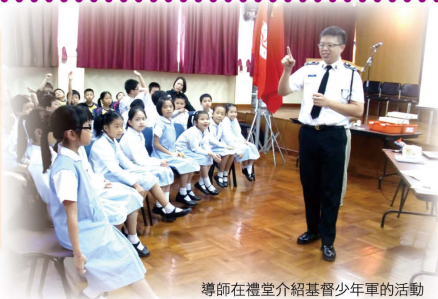
導師在禮堂介紹基督少年軍的活動