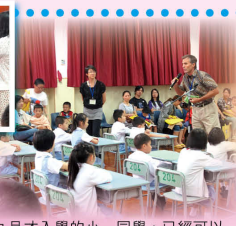
九月才入學的小一同學，已經可以向來賓展示拼音成果，真棒！