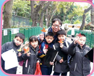
信愛學校的學生是純樸、天真、活潑和逗人喜愛的孩子