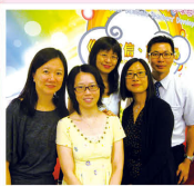
四位獲長期服務獎的同工與攝影師合照