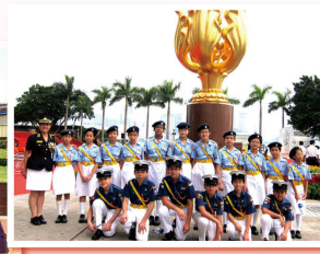
隊員參加10月1日金紫荊廣場國慶升旗禮。