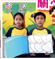
同學們把寫上慰問和祝福的心意卡集成一冊。