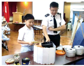
導師正在介紹露營用的物品

本校的基督少年軍於9月26日舉行了「香港基督少年軍第157分隊新隊員招募日」，招募三年級的同学成為新隊員。新隊員入隊後，導師會透過集隊活動，配合不同級別的獎勵計劃，使隊員在身、心、社、靈方面得到均衡的發展，學習與人相處的技巧，在個人成長訓練中鍛煉毅力，在領袖訓練中建立自信，培養他們成為愛主的基督徒、青少年領袖及社會中的良好公民。