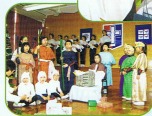
學生參與聖景的演出