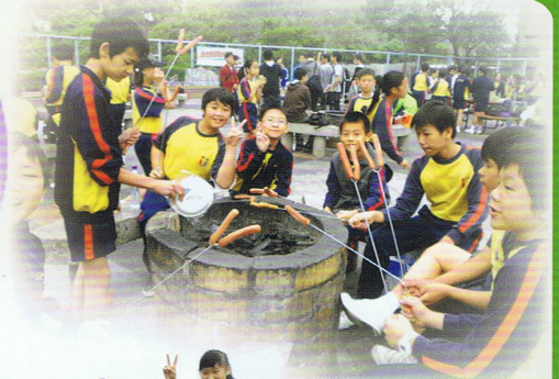
齊來燒烤，有美味的腸仔、雞翼、豬扒、牛扒，還有……