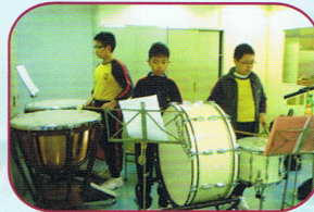
敲擊樂班同學努力學習