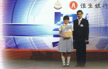
楊琦同學與警務處處長鄧竟成先生合照