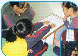
坐地前伸 - 學生指導測試者進行量度