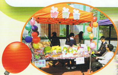
我們預備了豐富的禮物供大家抽獎