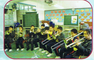
小號、伸縮號班的同學齊齊大合奏。

本校的信愛管弦樂團於近年屢獲社區團體及幼稚園之邀請，到商場及社區會堂擔任節日活動的表演隊伍。從2004年起，信愛管弦樂團更開始參與「港島東區聯校音樂匯演」，跟東區多所著名的中學切磋音樂的技藝。另外，本校的學生在每年舉行的皇家音樂學院考試及校際音樂節比賽中均獲得優異的成績。