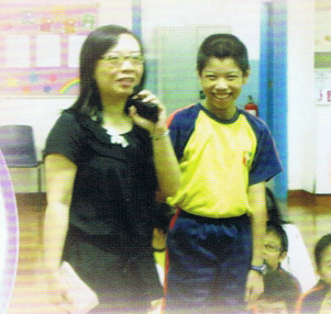
香港家庭計劃指導會導師到校主持「豆芽夢」講座