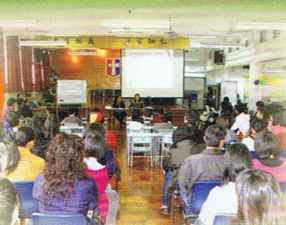
來賓聚精會神地欣賞教學示範