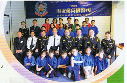
本校交通安全隊榮獲本年度「傑出學校獎」，由香港警務處港島總區周秉榮高級警司頒發獎項給隊員。