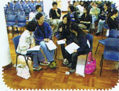
家長興高采烈地討論，很投入呀！