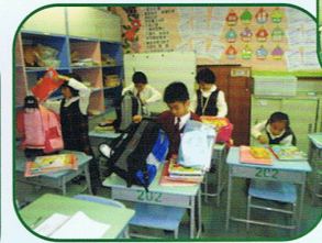
一年級同學能否懂得收拾書包？