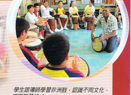
學生跟導師學習非洲鼓，認識不同文化，擴闊學習領域。