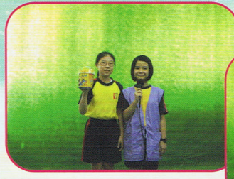
本週主題—「我最喜愛的食物」

為了讓學生有多些機會運用英語，英文科於早會時間特設不同的節目，如：英語週主題介紹、各班同學以英語作不同形式的表演，藉此培養學生的自信心。