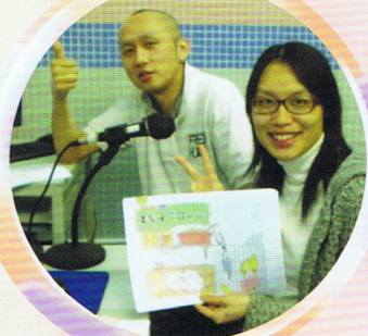
老師透過圖書推介，傳揚關愛訊息。

本年度閱讀的主題為〈快樂人生源自愛/Pursuit of happiness: Love〉。目的是透過以〈關愛〉為主題的圖書，將關愛教育寓於其中，藉此提升學生正面價值觀。為配合主題，圖書組與各科組合作，舉辦多項活動，如話劇比賽、寫作比賽等。此外，老師亦根據這個主題，推介以關愛為題的圖書，讓學生能受圖書內容所感染，更懂得關愛別人，使生活活得更快樂而豐盛。