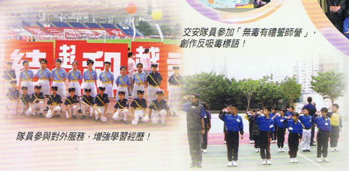
隊員參與對外服務，增強學習經歷！