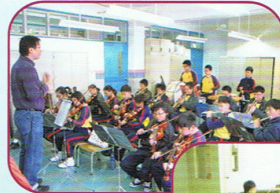
管弦樂團的同學為演出努力地練習

本校早於1999年成功獲得優質教育基金資助，購置樂器及開辦各種樂器班。為進一步提升學生演奏樂器的技巧和水平，本校特別開辦器樂小組(弦樂小組、管樂小組、敲擊樂小組)和管弦樂團訓練課程。