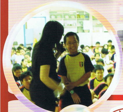
學生聽後頗有反思

學校關注學生進入青春期的心理發展，每年舉行「豆芽夢」講座，協助學生對「愛情」、「異性追求」有更清晰的看法。