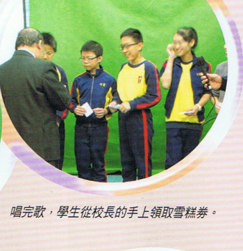
唱完歌，學生從校長的手上領取雪糕券。