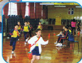
六/九分鐘耐力跑 - 學生協助數圈