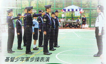
基督少年軍步操表演