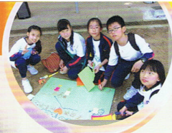
交安隊員參加「無毒有禮誓師營」，創作反吸毒標語！