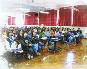
陳先生的講解引起家長的共鳴