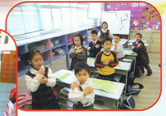
學生邊帶感情地朗讀，邊做動作，感受文字的深層意義，感受文字的優美。