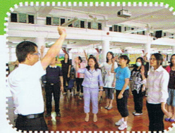
老師齊來學習「腦科學」