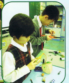
二年級同學正在嘗試自行安裝電池，啟動電動玩具。