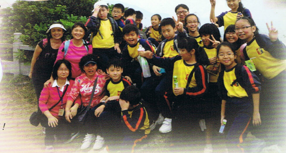
快樂的時刻，永遠難忘！