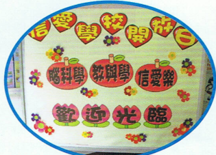
信愛學校歡迎你們