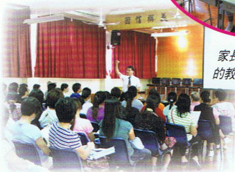
腦科學與你息息相關