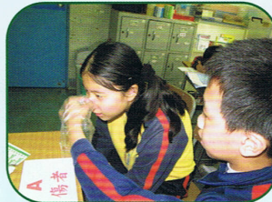
六年級同學正在接受簡單急救技能評估