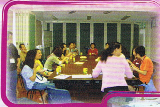
家長義工分享茶聚