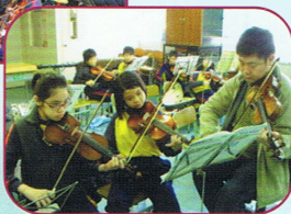
小提琴班學生專心上課