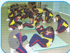
仰臥起坐 - 學生協助測試者完成動作及數次數