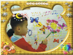
以動物造型作框架，相片立即變得生動有趣!