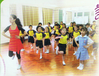
創意舞，多姿態，跑跑跳跳多快樂！