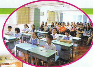
家長欣賞我們的教學示範