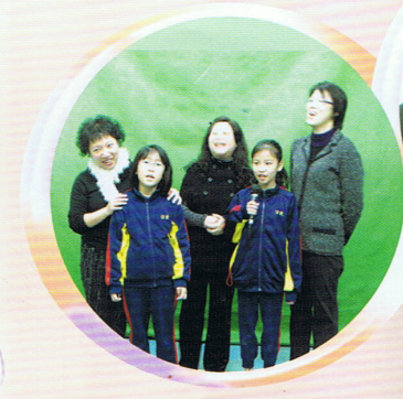
以唱歌形式學唐詩，既可以吃雪糕，又可以學到普通話，而最重要是唐詩再也不難記。