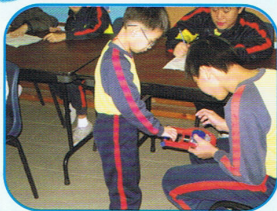
手握力測試 - 學生協助測試者量度

體適能測試的目的是透過一些運動，測試學生的心肺功能、身體協調、肌肉力量及身體柔軟度。測試結果顯示學生的體能水平，令學生明白自己身體的強弱，促進他們恆常地進行體育運動。是次測試由高年級6智班學生協助進行，體現學生互助互愛的精神。