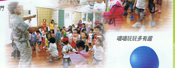
外籍老師教小孩唱兒歌