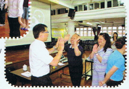
校長、副校長積極參與學習培訓活動。