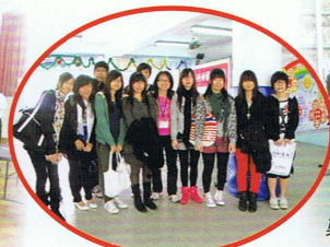
本校畢業生與老師在成果展示區前留影