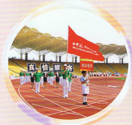
本校交安隊隊員為校外團體做儀仗服務，帶領運動員進場！