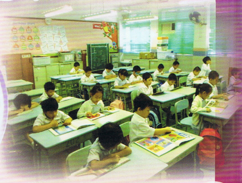
學生於早讀課內安靜而專注地閱讀，享受閱讀帶來的樂趣。