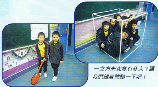
一立方米究竟有多大？讓我們親身體驗一下吧！