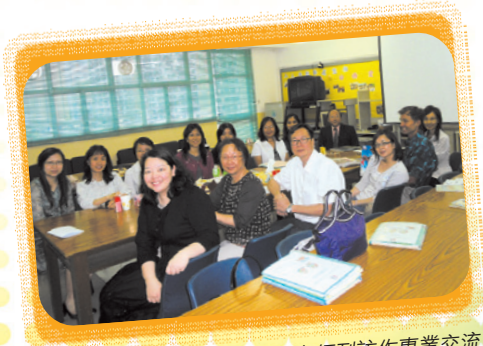
本校歡迎嘉諾撒聖芳濟學校老師到訪作專業交流。

本校一向致力推動校內英文閱讀風氣，以提升學生語文能力，所用的策略屢獲業界讚賞，並分別於2008及2010年被教育學院及教育局邀請與教育界同工分享經驗。本年六月四日嘉諾撒聖芳濟學校一行九位老師包括課程發展主任、英文科科主任、圖書館主任及其他老師到訪本校與校長、圖書館主任及英文科相關老師作專業交流。目的是想瞭解本校英文閱讀及自我挑戰獎勵計劃的詳情及執行方法，以作參考或借鏡之用。交流會上，嘉諾撒學校老師對本校推行的閱讀策略及獎勵計劃十分欣賞並垂詢甚殷。