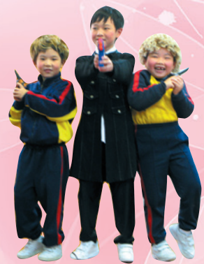
戲中的兩位傑出男小演員正在為 James Bond 的出場造勢！