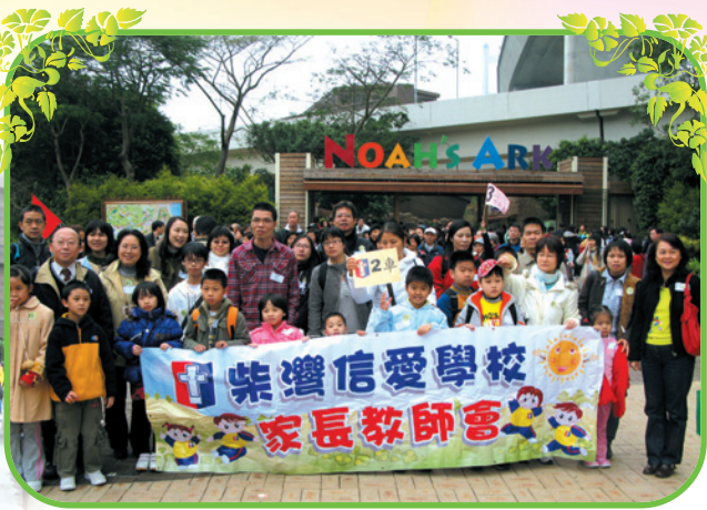
我們進入「馬灣挪亞方舟花園」前，分組先拍一張大合照！