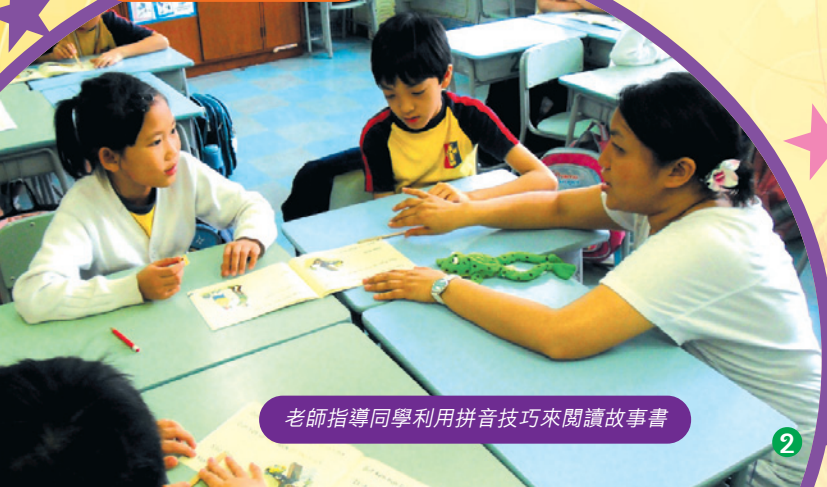
老師指導同學利用拼音技巧來閱讀故事書