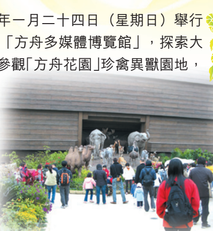
家長和子女漫步「方舟花園」，探索珍禽異獸園地，觀賞造型栩栩如生之各式野生、稀有及瀕危動物雕塑。

下午乘車到荃灣悅來酒店吃豐富的自助餐後，再去參觀「航天城翔天廊」。當日節目豐富，令參加者共渡一個愉快的週日。