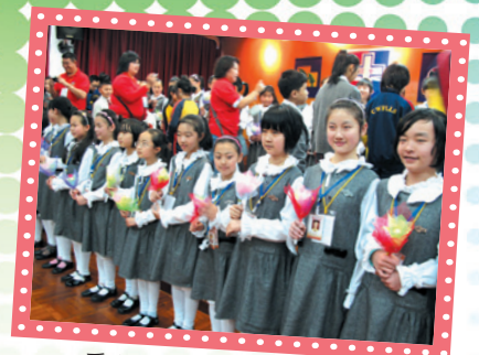
重慶市小學生來校作交流活動，還為我們演出交通手號操