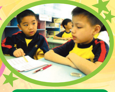
同學上課時會互相合作，一起切磋，共同拼出生詞的讀音。