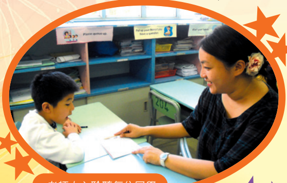
老師小心聆聽每位同學的發音是否正確並加以個別指導。

未來兩年，本校會善用這筆經費，培訓所有英文老師以便全面發展這個集拼音、閱讀與寫作於一身的綜合課程，並會將計劃逐年延伸至四、五、六年級，使全校各級同學均可得益。