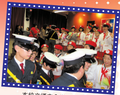
本校交通安全隊員與北京八角小學學生交換紀念品

香港交通安全隊藉著周年大會操，邀請北京市石景山區八角北路小學3名領導、32名鼓樂團學生及40名重慶市多間小學學生代表、5名工作人員來港交流。逗留香港期間，他們探訪本校並在本校進行表演及交流。