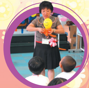
老師正在教授同學怎樣扭出色彩繽紛不同形狀的汽球。