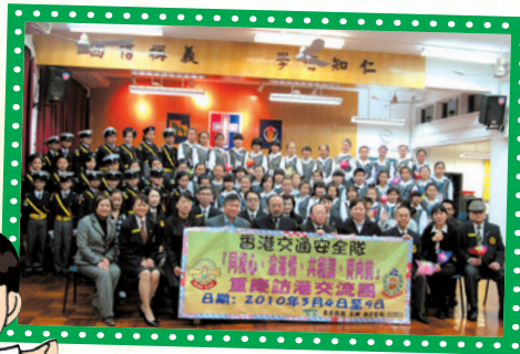
「同根心、渝港情、共和諧、齊向前」 重慶市訪校互動交流