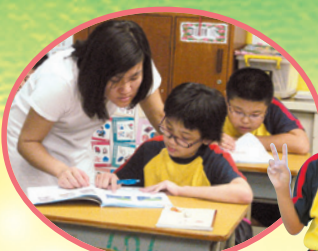
姐姐教我做功課，真好！