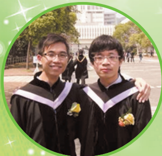
此圖為大學畢業時與同學所拍， 圖右為本人

母校對我十分重要，因為我第一次接觸聖經道理就是在信愛。因為認識了上帝，並得身邊朋友的幫助，使我克服不少的困難，在事情不如意時，仍然能努力向前。我希望日後有機會能回饋母校，協助學弟學妹，在課後輔導他們的功課。祝母校校譽日隆！