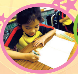
同學運用從書中學到的詞彙，用心地寫作句子。