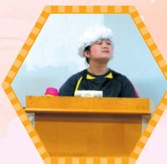
獲得傑出女演員獎的大法官出庭了，看她多神氣！

同學於台上表演得揮灑自如，把 Cinderella, James Bond, Michael Jackson, 大法官等演繹得十分全神。評判對同學的鬼馬演出及戲服設計尤其讚賞！