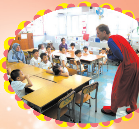
我們的外籍老師化身成為「超人」，給幼稚園的小朋友一個驚喜。