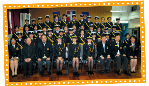
交通安全宣傳大使 hotcha 來校探訪學生，與我校交通安全隊員合照