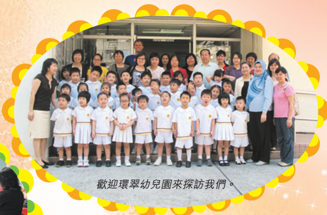
歡迎環翠幼兒園來探訪我們。