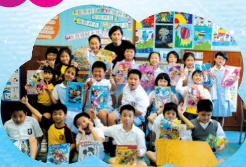
每人都有一份生日禮物！