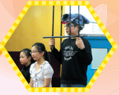
接受審訊中，大惡狼和身邊的律師神情凝重，演技十分精湛。