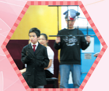
連 Michael Jackson 都要為大惡狼平反？大法官會否相信他的證供呢？