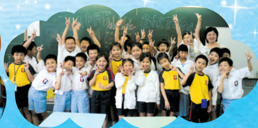
有得開生日會，真開心！