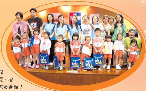
路德會杏花邨 幼稚園的校長、老師、同學及家長合照！

在 2010 年 5 月 29 日（星期六），本校為本區幼稚園學生舉辦「信愛啟發潛能 GO 高 GOAL」，目的是讓幼稚園生提早了解小學課程並體驗箇中樂趣；家長方面，本校提供教學示範及有關啟發兒童潛能講座，讓家長獲益良多。