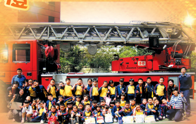
同學在消防車前留影

本校為了提高學生之學習興趣，以收教學事半功倍之效，特為二年級同學安排到柴灣消防局作戶外學習，內容包括了解消防員的日常工作情况，認識各種消防設備及親身體驗消防員的工作。希望同學透過從實際的環境中進行學習，將知識加以建構及應用。