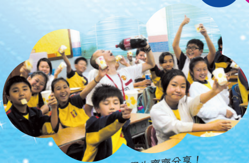
老師與學生齊齊分享！